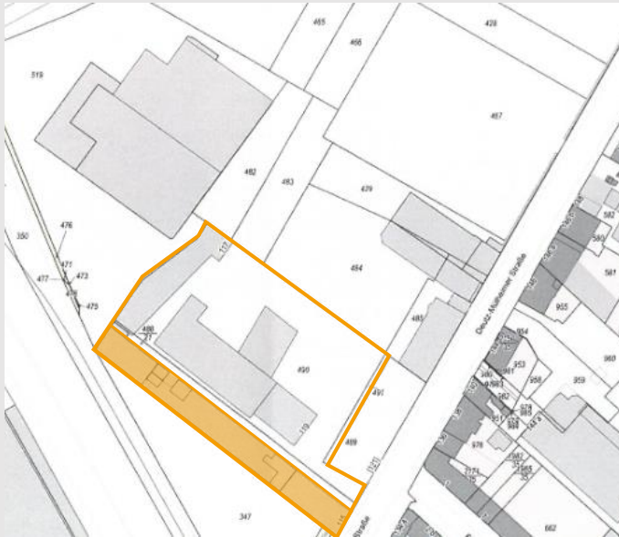
Katasterplan Erbbaurecht vergeben an Nutzer